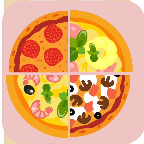
サラミ、ハムパイ ン エビバジル、マッ シュルーム