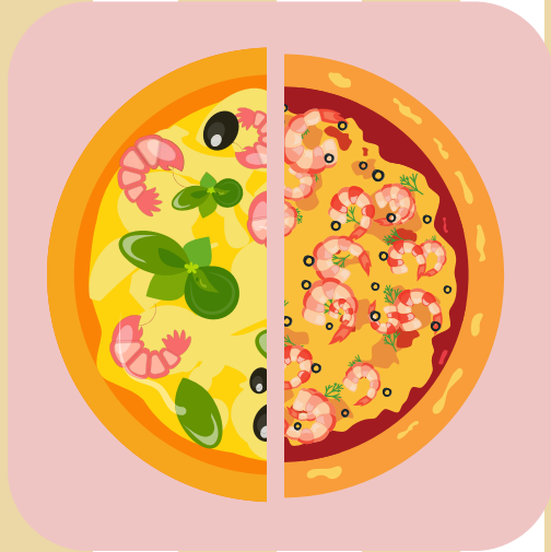
エビバジル、エ ビトマト ハーフ&ハーフ