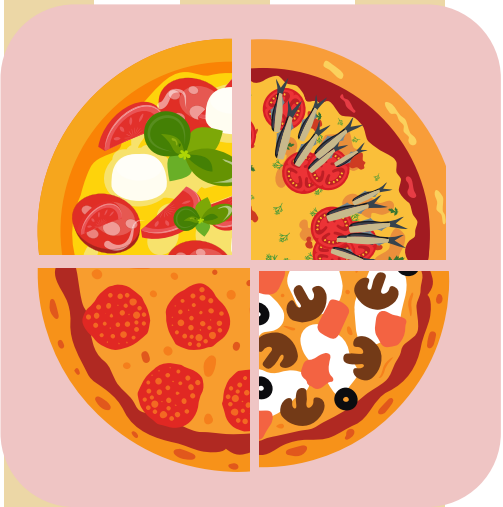
モッツアレラ、アン チョビサラミ、マッ シュルーム