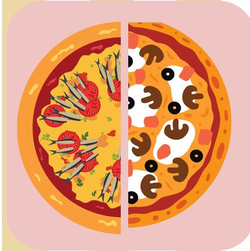
アンチョビ、マッ シュルーム ハーフ&ハーフ