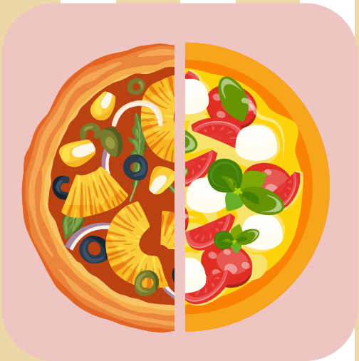
パインオリーブ、モ ッツアレラ ハーフ&ハーフ